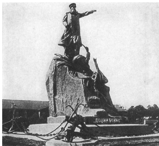
Памятник С.О.Макарову в Кронштадте