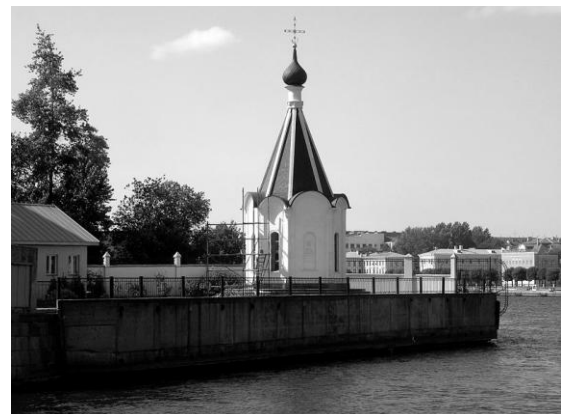
Современная часовня на месте храма Спаса-на-водах