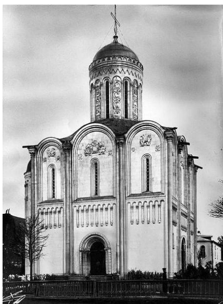
Храм Спас-на-водах - памятник Цусимскому сражению